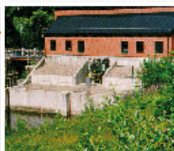
Ålsätra Byggs 1986 1,4 MW effekt