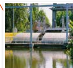
Ramnäs Byggs 1960 5,0 MW effekt