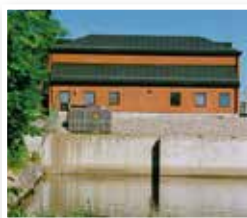
Seglingsberg Byggs 1986 1,5 MW effekt

Mälarenergi driver 41 vattenkraftstationer runt om i Västmanland och Värmland.