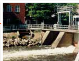
Sörstafors Byggs 1937 0,7 MW effekt