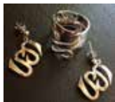
Kolbäcks Hembygdsförening Stationsgatan 12, Kolbäck Tavlor, skrifter, foton, hemslojd www.kolbacksbogden.se

13 Kolbäcks Gästgivaregård, Tingshusgatan 3, Kolbäck 0220-403 60 www.kolbacksgastgivaregard.se Äta, fika, bo