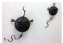
Smedja Levay AB