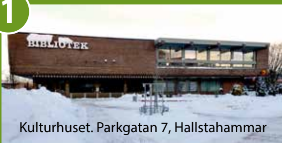
Kulturhuset. Parkgatan 7, Hallstahammar