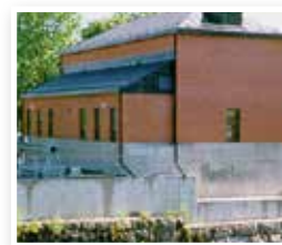
Virsbo Byggs 1986 1,4 MW effekt